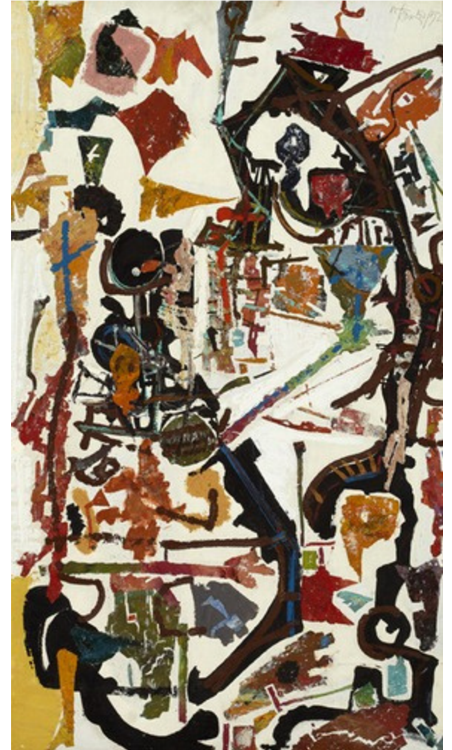
Harold Town, Bagatelle, 1952, oil, sand, lead zinc ground on masonite. Gift of the artist's estate.