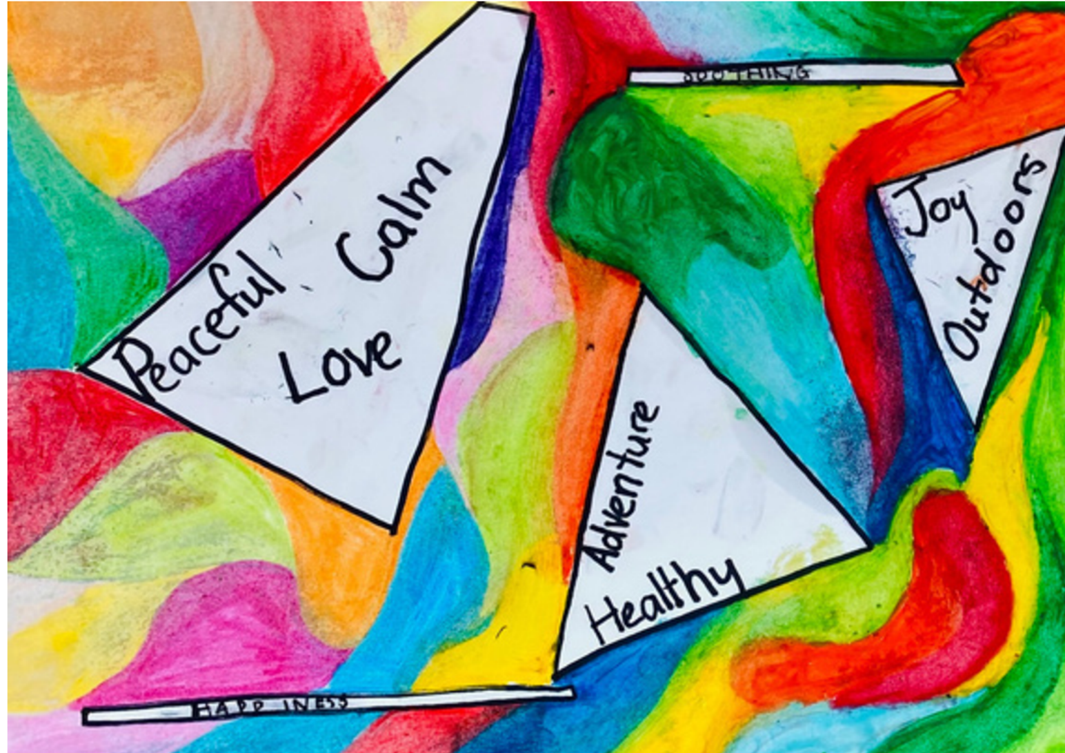
Illustration P11 et Positive Spaces. Exemple du RMG, technique mixte