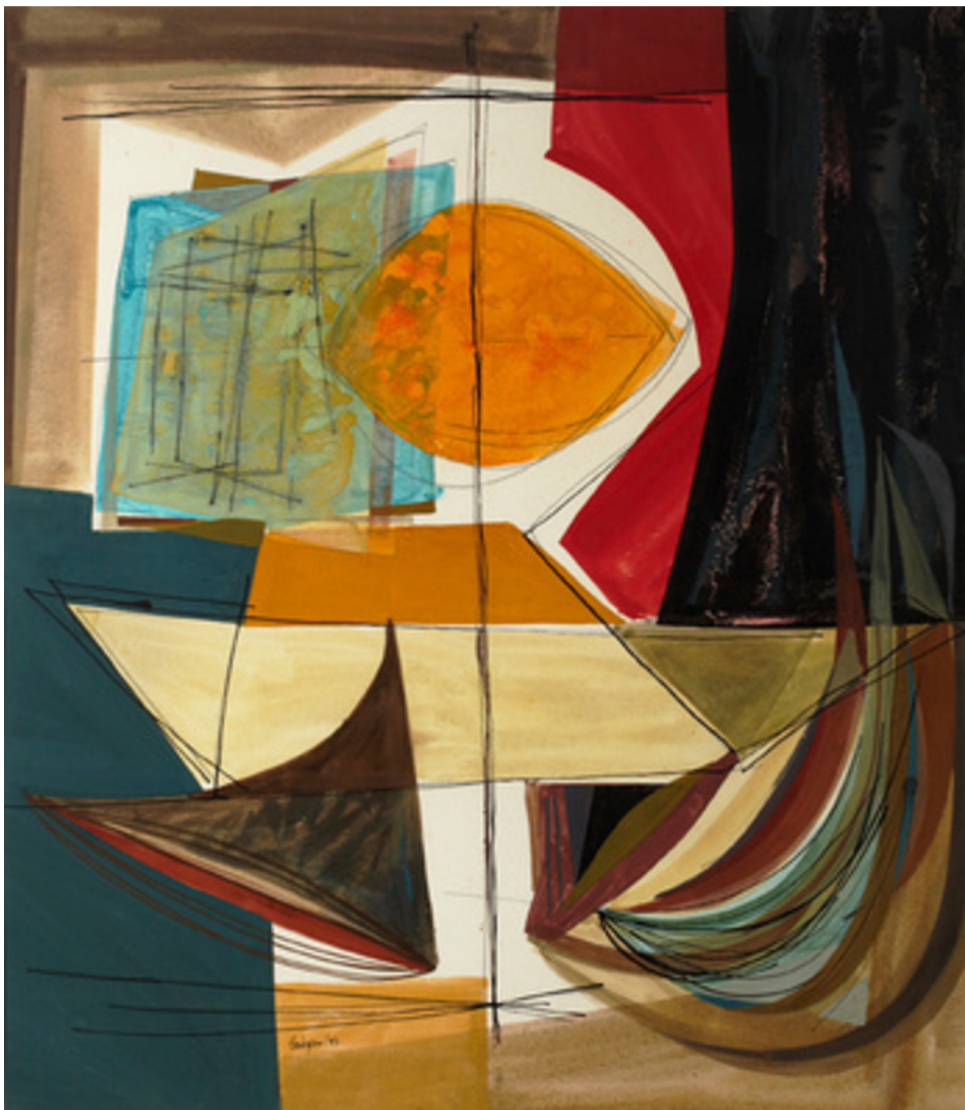
Tom Hodgson, Non-objective Water Colour, 1952, gouache; watercolour; ink; graphite on illustration board. Purchase, 1970

Choisissez l'image ou les formes que vous souhaitez utiliser. Une fois votre choix de formes fait, découpez-les.